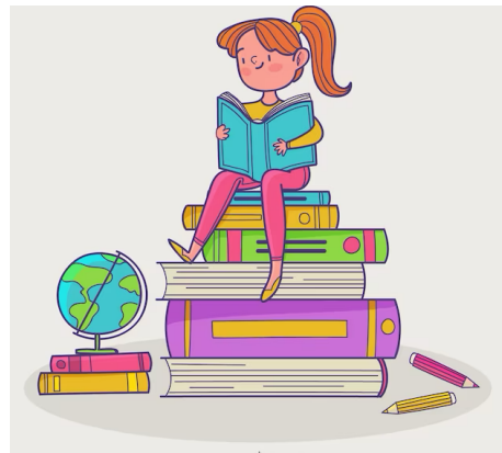
Estudiar “to Study”

These verbs follow a regular pattern in the present tense. For other tenses, like the preterite, imperfect, or future, the conjugation will change according to specific rules.